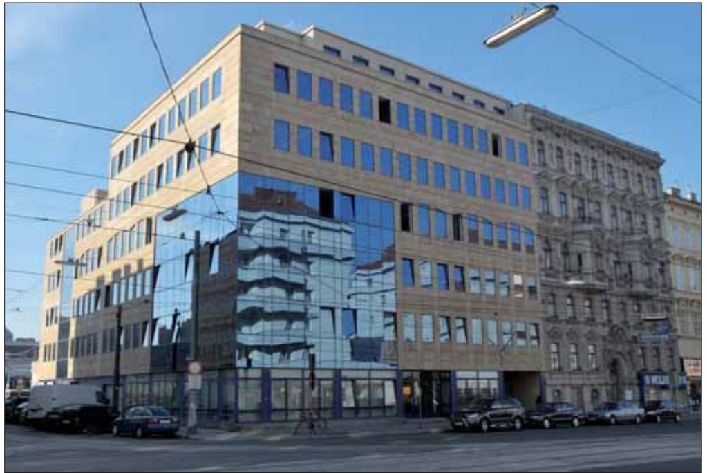
Asylgerichtshof: Gerichtliche Rechtsmittelinstanz in Asylsachen seit 1. Juli 2008. Vorher war dafür der Unabhängige Bundesasylsenat als verwaltungsbehördliche Instanz zuständig.

Visum (Sichtvermerk): Amtlicher Vermerk, der vor oder beim Grenzübergang erteilt wird und aus dem die Erlaubnis zum Überschreiten der Staatsgrenze und zum Aufenthalt für einen maximal sechsmonatigen Zeitraum hervorgeht. Das Visum ist nicht verlängerbar und