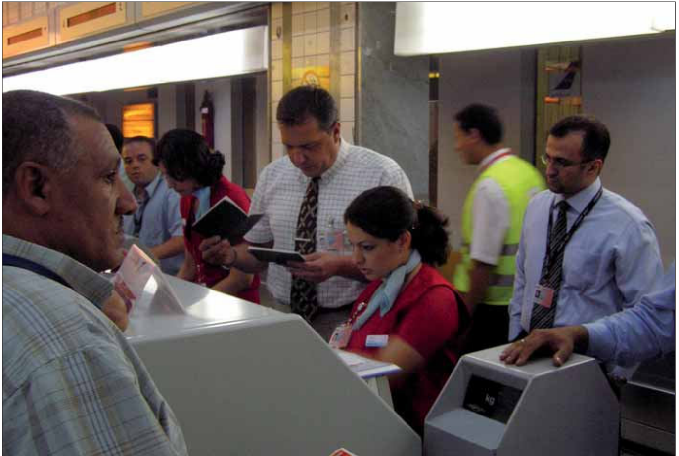
Dokumentenberater: Speziell ausgebildete Polizisten im Erkennen von ge- oder verfälschten Dokumenten, die an Flughäfen in Ländern tätig sind, aus denen vermehrt illegal Einreisende stammen.

Niederlassungs- und Aufenthaltsgesetz: Am 1. Jänner 2006 im Rahmen des Fremdenrechtspakets 2005 in Kraft getreten; regelt das Aufenthaltsrecht von Fremden, die sich länger als sechs Monate in Österreich aufhalten, weiters unter anderem die neu gestalteten Aufenthaltstitel, die Integrationsvereinbarung und die Familienzusammenführung.